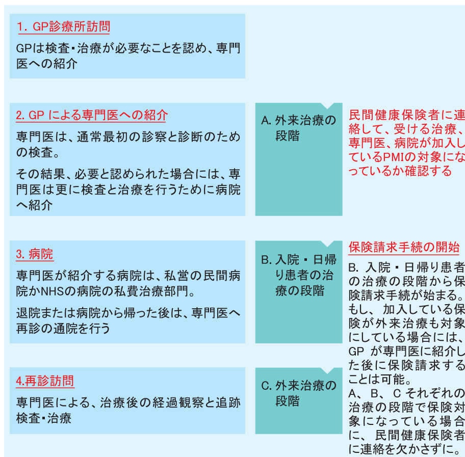
《図表 4》 私費治療の患者となった場合の治療の流れと保険請求